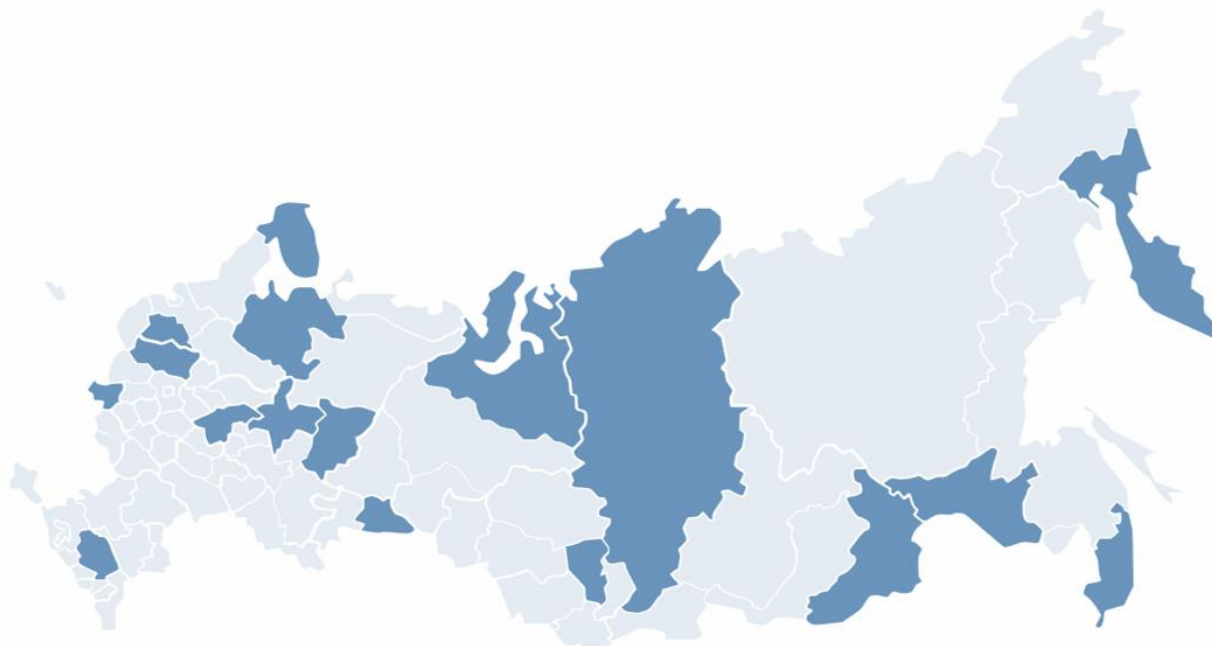
Рис. 1 География создания муниципальных округов

Сейчас в России уже формируется 101 муниципальный округ (См. Рис. 1). К 01.01.2021 запланировано еще 13 преобразований. По результатам этих реформ к существующим регионам с почти или полностью отсутствующим поселенческим уровнем 36 добавятся Ставропольский и Пермский края, Кемеровская область.